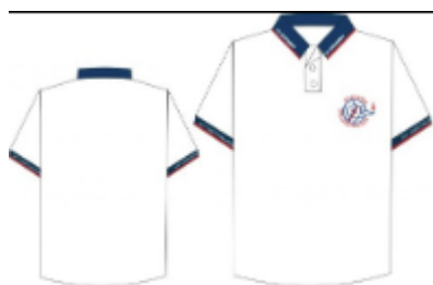
Farda para Ed. Física: regata e bermuda oficial da escola

Farda oficial: Camisa pólo oficial da escola e calça jeans azul tênis: azul, cinza, branco ou preto